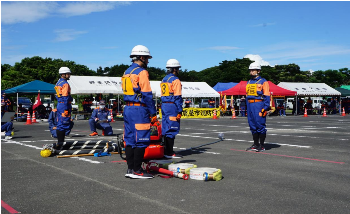
肝属支部消防操法大会の様子