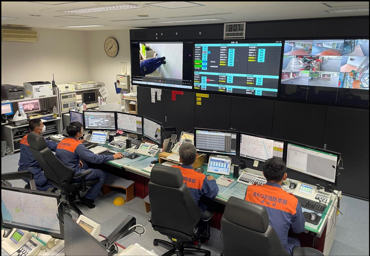
通信指令室の状況